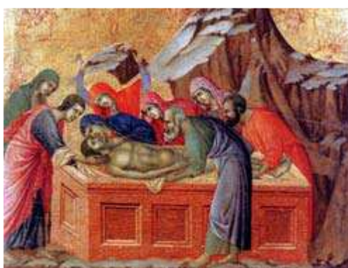
22 - Sepoltura

Era il giorno della Parascève e i Giudei, perché i corpi non rimanessero sulla croce durante il sabato - era infatti un giorno solenne quel sabato -, chiesero a Pilato che fossero spezzate loro le gambe e fossero portati via. Vennero dunque i soldati e spezzarono le gambe all'uno e all'altro che erano stati crocifissi insieme con lui. Venuti però da Gesù, vedendo che era già morto, non gli spezzarono le gambe, ma uno dei soldati con una lancia gli colpì il fianco, e subito ne uscì sangue e acqua. Chi ha visto ne dà testimonianza e la sua testimonianza è vera; egli sa che dice il vero, perché anche voi crediate. Questo infatti avvenne perché si compisse la Scrittura: «Non gli sarà spezzato alcun osso». E un altro passo della Scrittura dice ancora: «Volgeranno lo sguardo a colui che hanno trafitto».